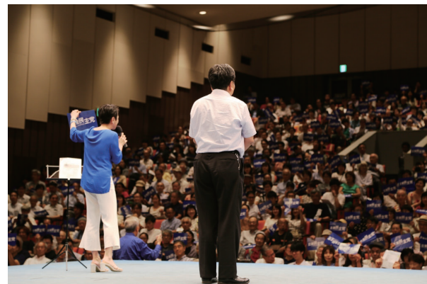
パートナーズ、国会議員、都道府県議員、区市町村議員とでイベントなどを開催していきます