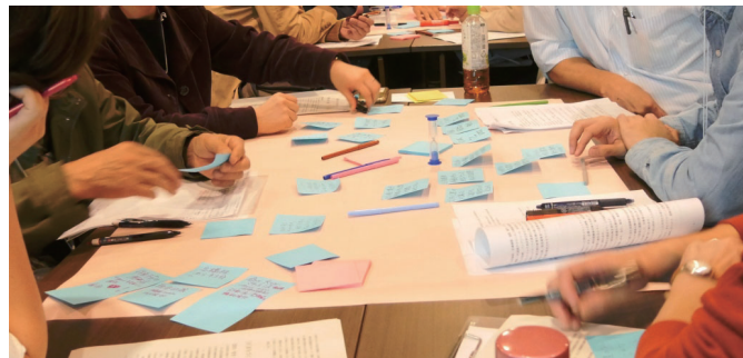
パートナーズと各地でワークショップやタウンミーティングなどを開催していきます